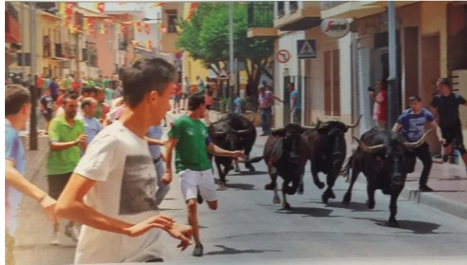
Bous al carrer

La música, el baile, los toros y la gastronomía están siempre bien presentes en sus celebraciones. De entre los diferentes festejos que celebra la localidad, las fiestas dedicadas a San Juan Bautista son los más destacados. Además de los espectáculos musicales de todo tipo se suceden las actividades deportivas y culturales, así como exhibiciones pirotécnicas y las degustaciones gastronómicas. Los toros también están presentes, tanto los de la plaza, como los bous al carrer .