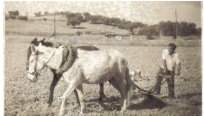
Caballo arando la tierra

La industria azulejera marca un giro en la vida de las gentes de San Joan de Moró y supone para el municipio un aumento considerable del número de habitantes así como la llegada desde los más diferentes puntos de España de gente en busca de un trabajo.