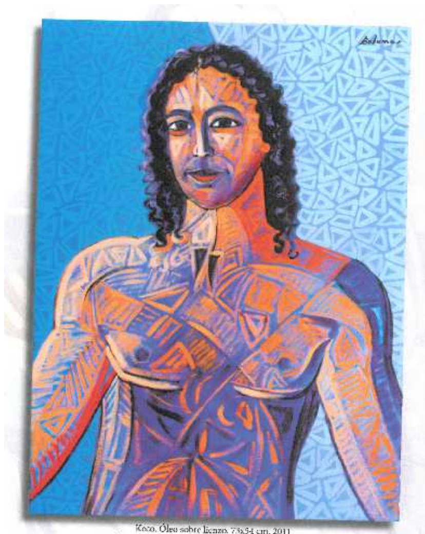
Koko. Óleo sobre lienzo, 73x54 cm, 2011

Soy muy exigente y crítico con mi trabajo y hasta que no estoy totalmente satisfecho no doy una obra por acabada.