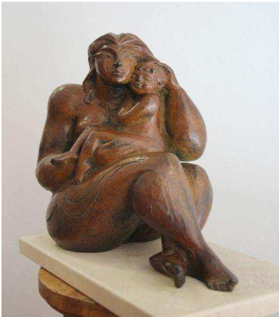
Maternidad, 30 x 25 x 20 cm, bronce, 2007.

Lo que más me gusta es la pintura, pero siempre sigo los pasos de los grandes maestros y todos ellos aparte de pintar son grabadores, escultores y ceramistas.