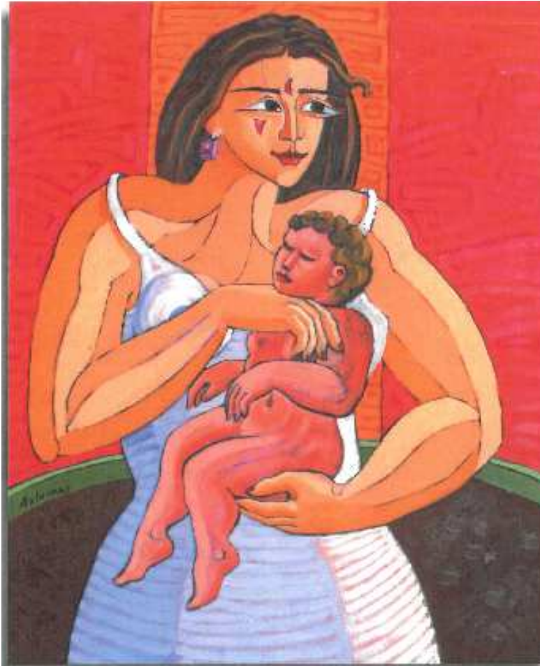
Maternidad en rojos. Óleo sobre lienzo. 73x60 cm. 2011

artista, además de entender su concepción sobre el arte. En definitiva, esta es la mejor manera de conocer un poco más a la gran persona que hay detrás del artista Luis Bolumar.