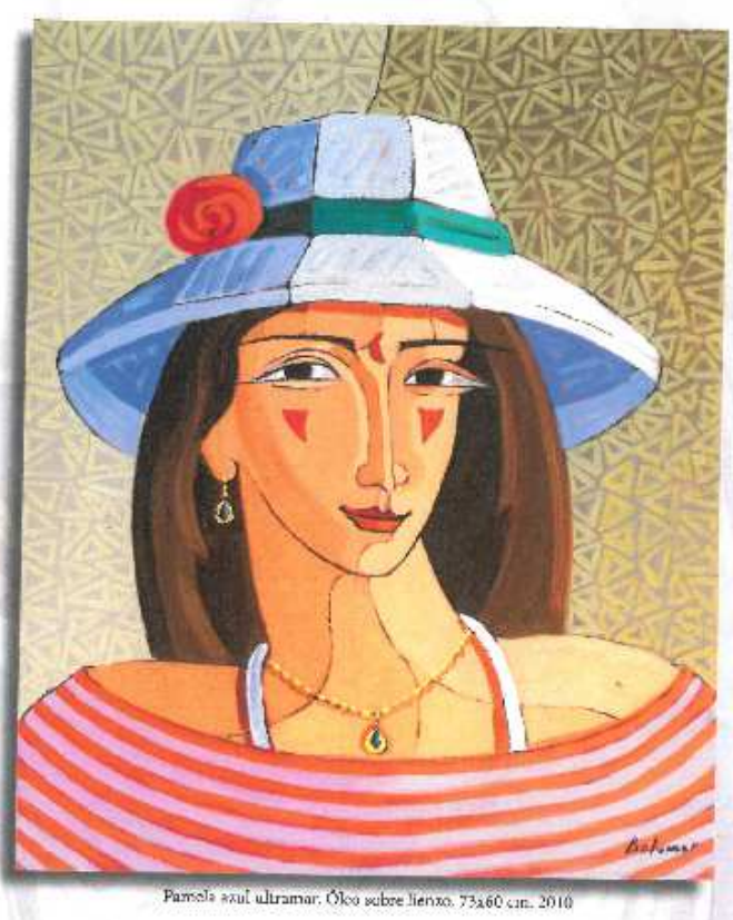
Paola azul ultramar. Óleo sobre lienzo. 73x60 cm. 2010

Mis obras dirían que están satisfechas conmigo porque en cada una de ellas doy lo mejor de mí