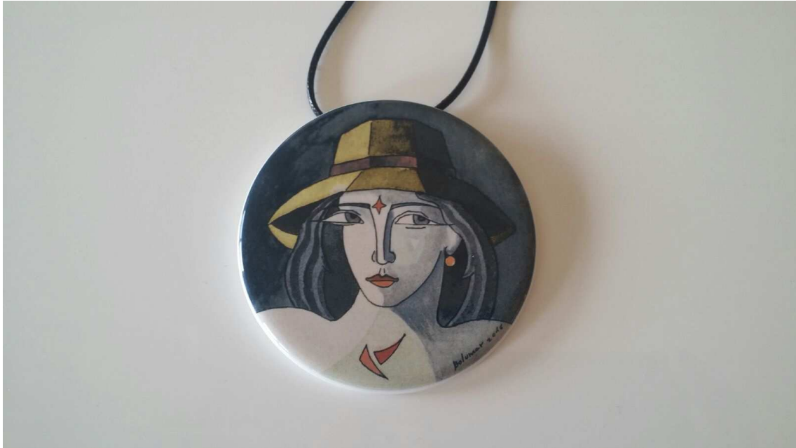
Medallón-cerámica 4/10 (2018)