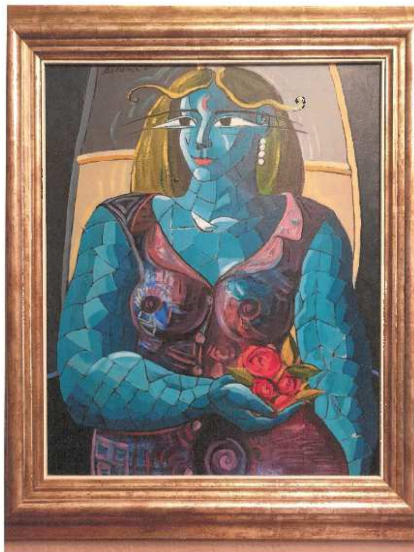
"PENSANDO EN LA LUNA" 28/03/2001