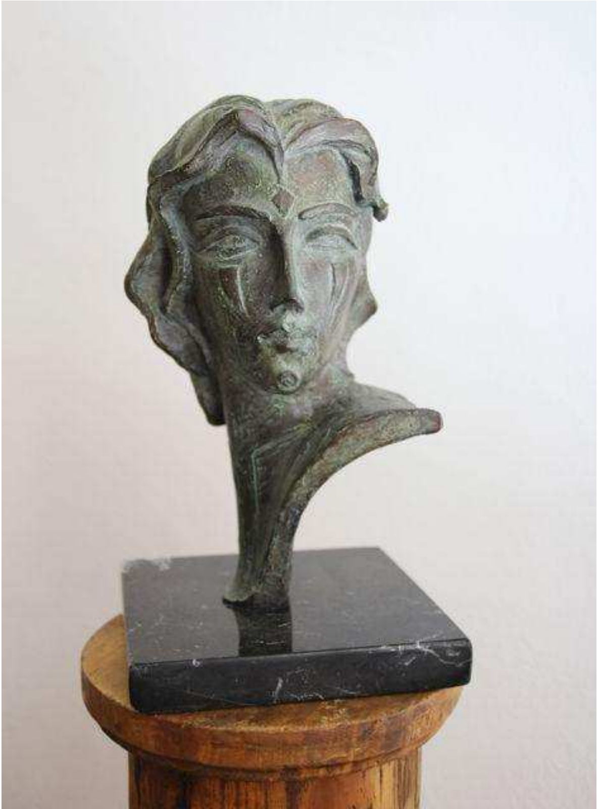
Orgullo , 33x20x18 cm, Bronce, 2006