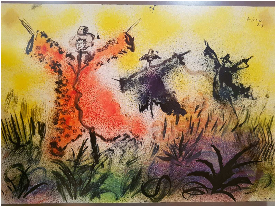
Los espantapájaros. Acuarela, 1975