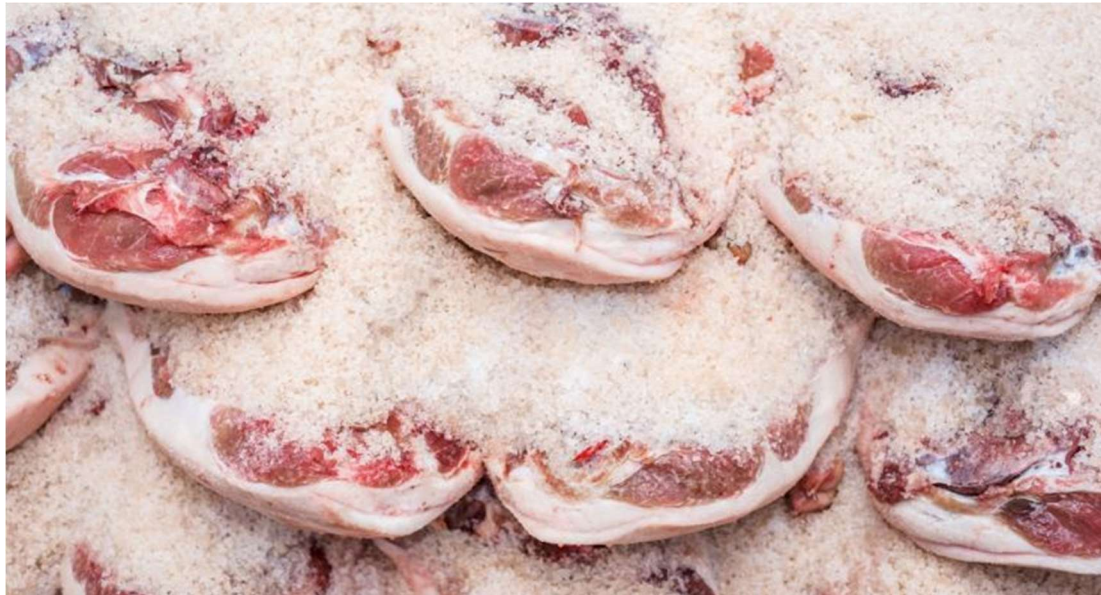
Jamones cubiertos con sal gorda

El proceso era totalmente natural y artesanal, y para ello se aprovechaban los meses más fríos del año