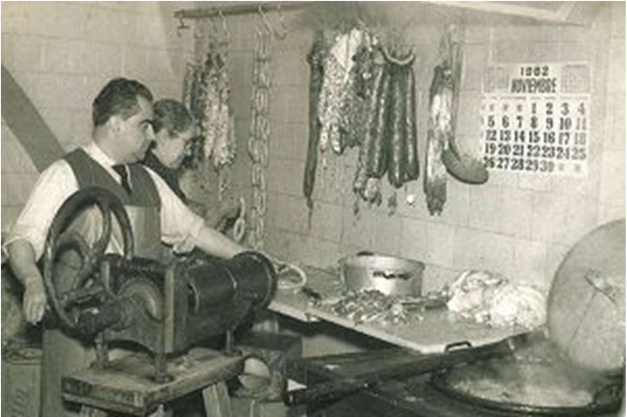
Carniceros elaborando embutidos en el obrador