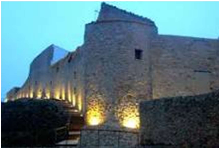
Muralla de Vistabella del Maestrat

Situado en un entorno en el entorno de Penyagolosa y en el Maestrat castellanense, este pequeño municipio castellanense de 339 habitantes ha experimentado una pérdida de población desde 1910 (2.540 hab.), acelerada desde el año 1950 (1.948 hab.). La economía del municipio se ha centrado en diferentes sectores durante su historia. En los siglos XVI y XVII destacó la actividad textil que progresivamente fue sustituida por actividades agropecuarias: la agricultura de secano.