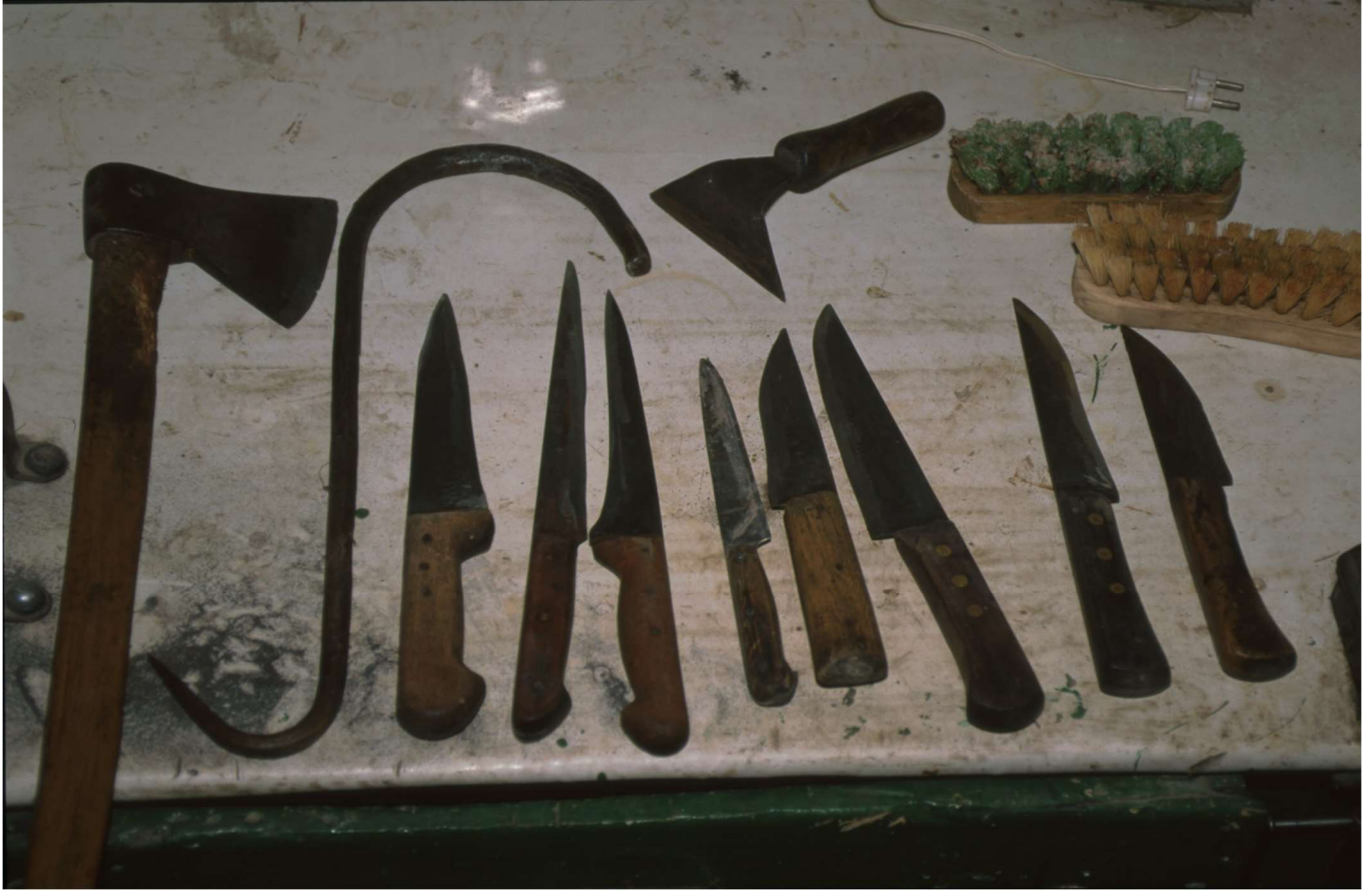
Herramientas que se utilizaban en el matadero