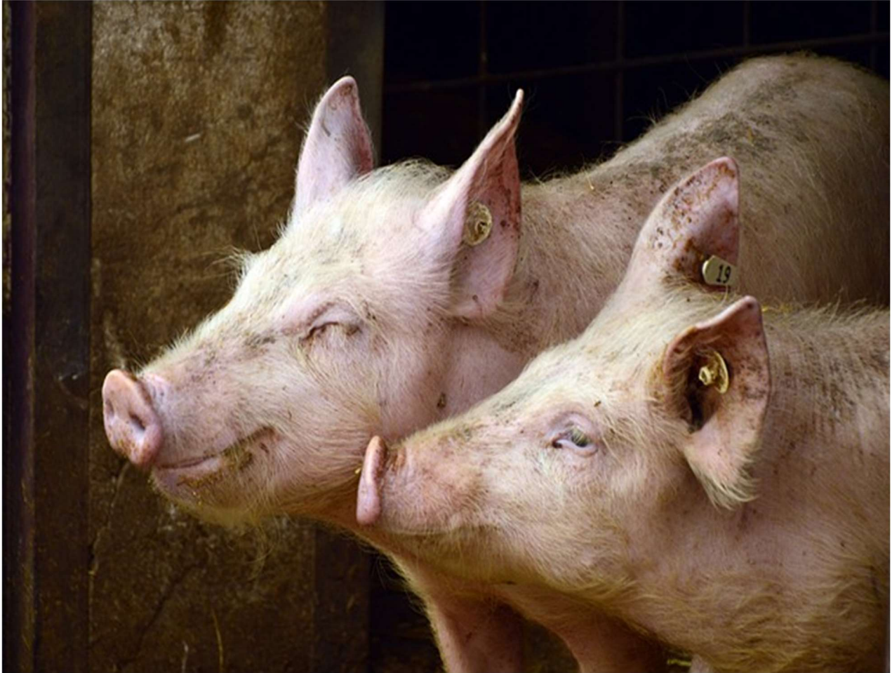
Cerdos en el corral