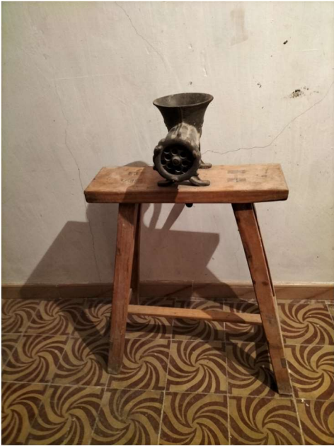
Máquina para picar carne manual