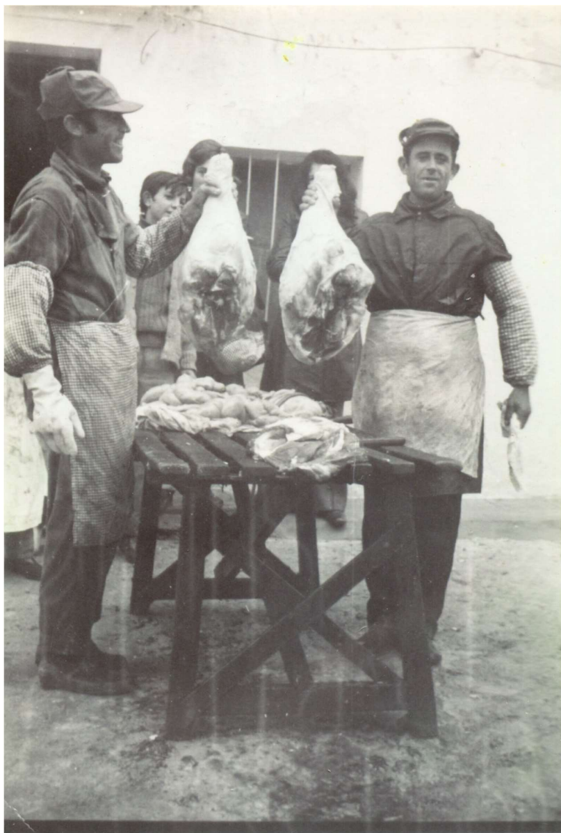
Despiece cerdo en el matadero

Mención especial era la del veterinario cuya inspección sobre las carnes del cerdo. Primero, cogía unas muestras que se llevaba y analizaba para descartar posibles enfermedades como la triquinosis (es un tipo de infección por nematodos o parásitos) .Cuando el veterinario daba el visto bueno se podía vender la carne