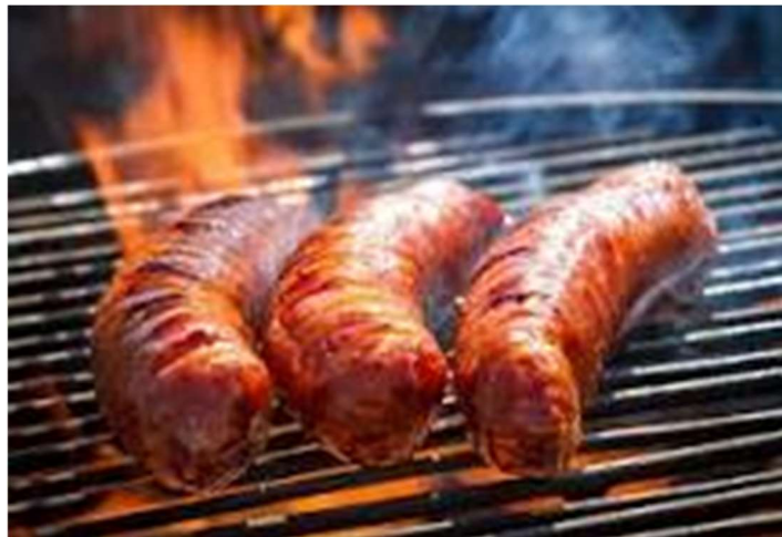
Chorizo a la brasa

Barbacoa: se forman en una tripa y luego se atada dividiéndose con una cuerda, conformándose una fila de chorizos más pequeños. Se suele utilizar para la plancha y la barbacoa