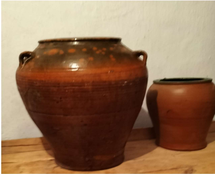
Orzas de barro se utilizaban para conservar el perol