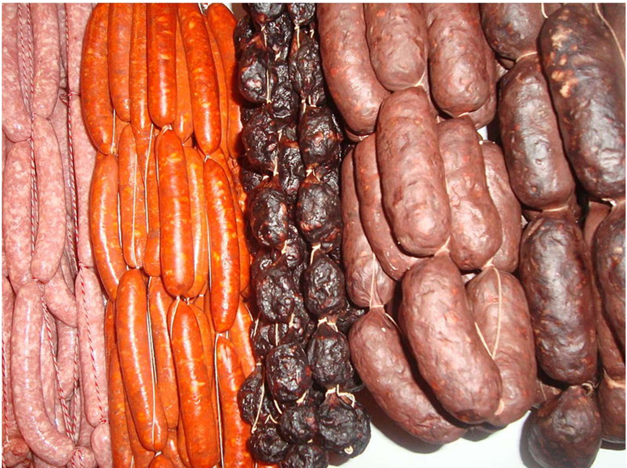
Embutidos típicos de Vistabella morcillas, longanizas y chorizos

Hoy en día los avances tecnológicos unidos a las técnicas artesanales y tradicionales dan a este tipo de productos una mayor