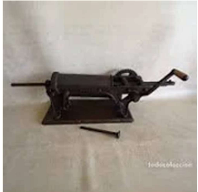
Máquina para embutir manual