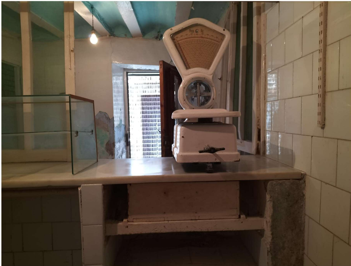
Despacho carnicería en Vistabella vista desde el interior.