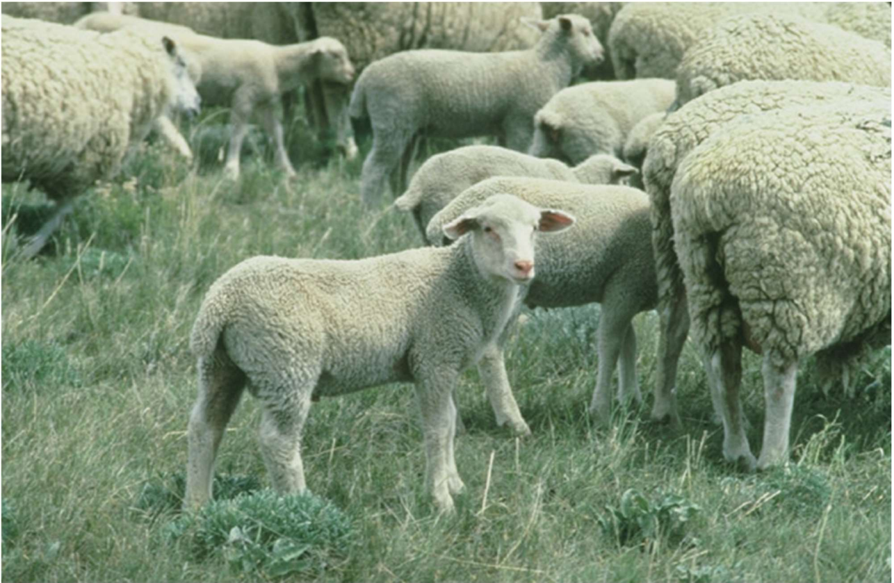
Rebaño de cordero pastando

Los cortes del cordero: cuáles son y cómo se preparan.