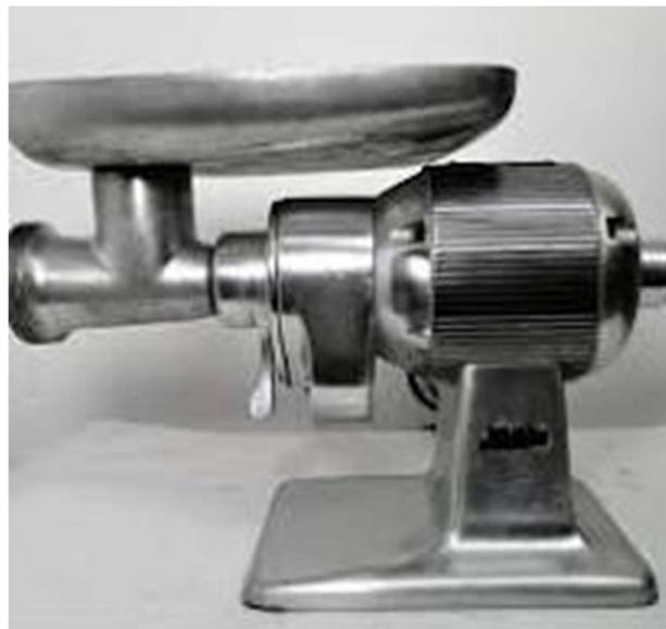
Primera máquina eléctrica que tuvieron para picar la carne