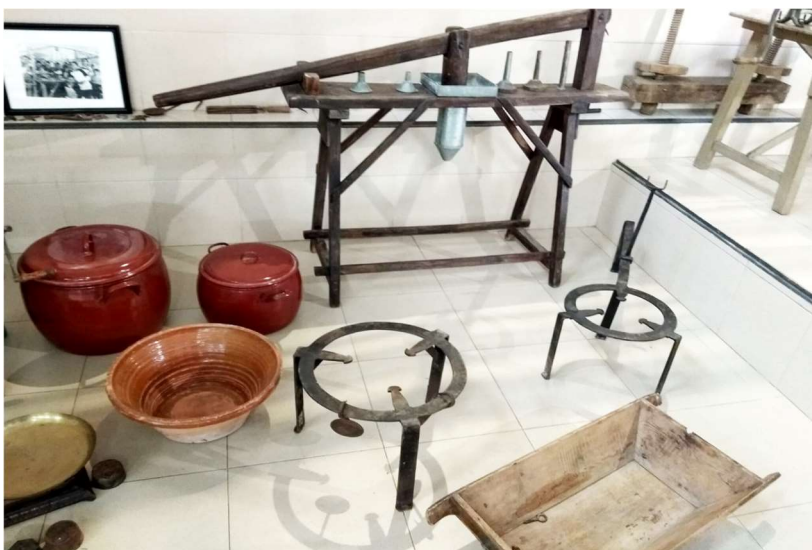
Máquinas y utensilios que se utilizaban en la carnicería años 50-60