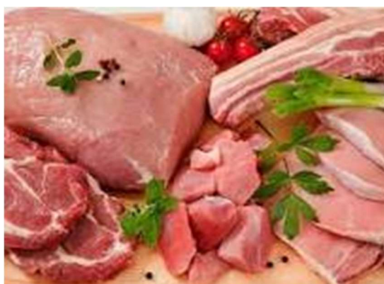
Lomo, magro y panceta de cerdo

-Tocino blanco: es la parte que recubre al lomo y se consume fresco o salado. Se utiliza principalmente para dar sabor o para elaborar foie gras .