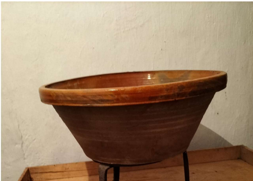
Lebrillo de barro en él se amasaba la carne para hacer embutidos