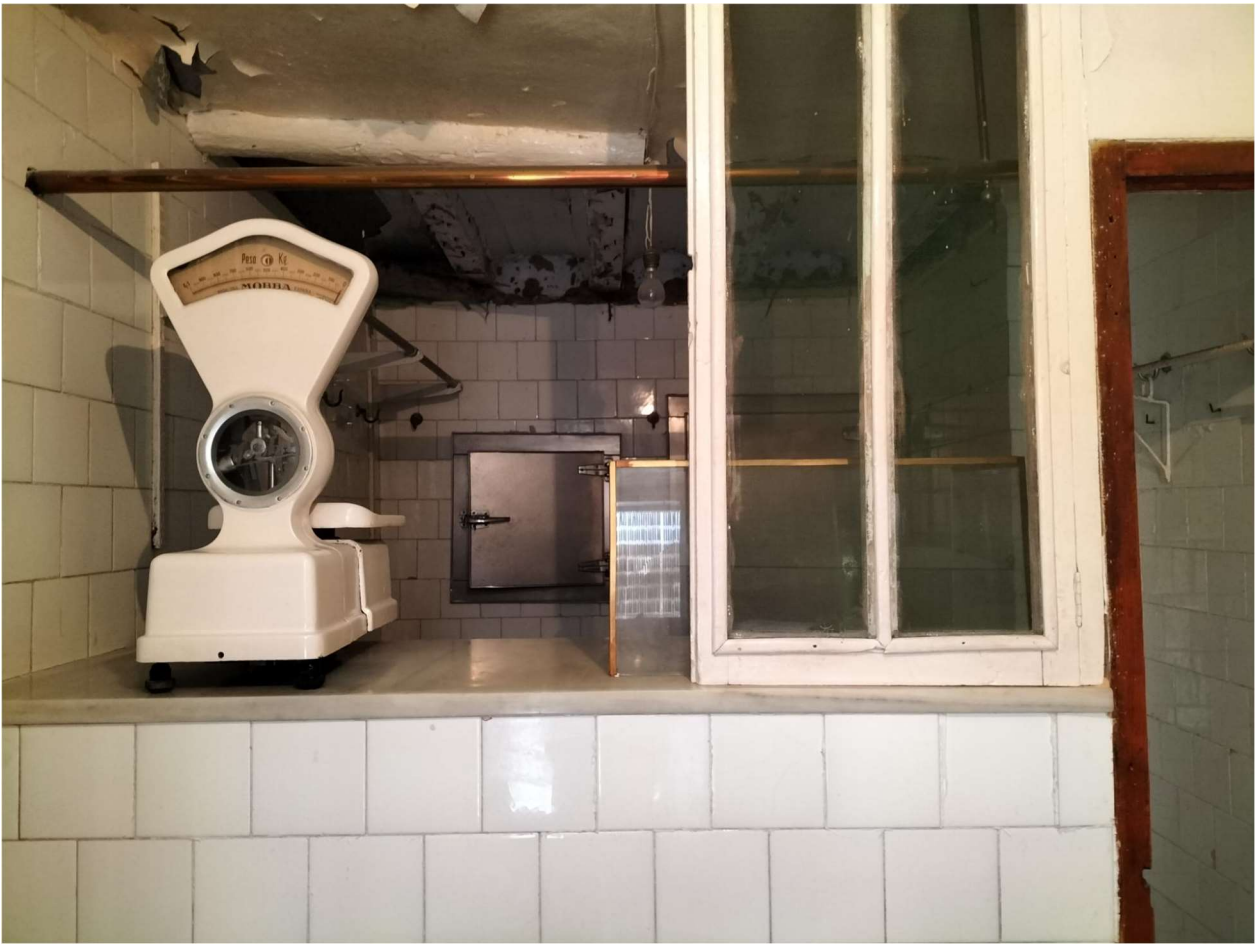
Mostrador con balanza