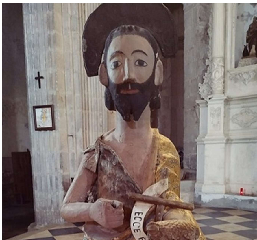
Foto San Juan de Peñagolosa restaurado

Sant Joan de Penyagolosa es el patrón de Vistabella y en honor a él se celebran las fiestas mayores en la última semana de agosto, siendo el 29 el día del santo. El 24 de junio también es festivo en Vistabella y se realizan una pequeña feria y misas en el santuario.