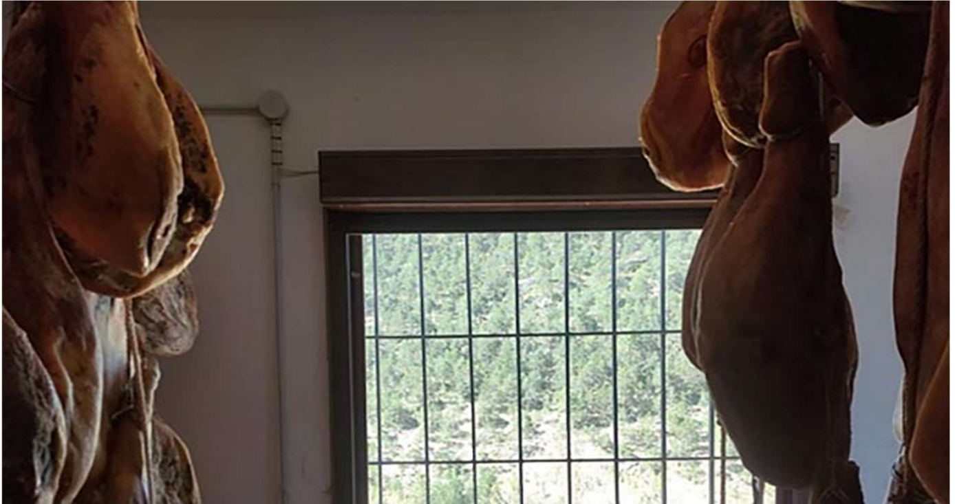
Secadero de jamones de forma artesanal

Tipos de jamón serrano según el tiempo curación: