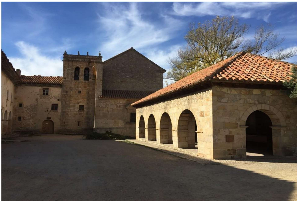
Foto Santuario de San Joan de Penyagolosa

En el siglo XVIII el ermitorio tomó la configuración en forma de “U” que conocemos hoy en día, cuando se construyeron dos cuerpos con arquerías de medio punto en la planta baja formando pórticos, sobre los que se edificaron habitaciones para ampliar Sant Joan de Penyagolosa es el patrón de